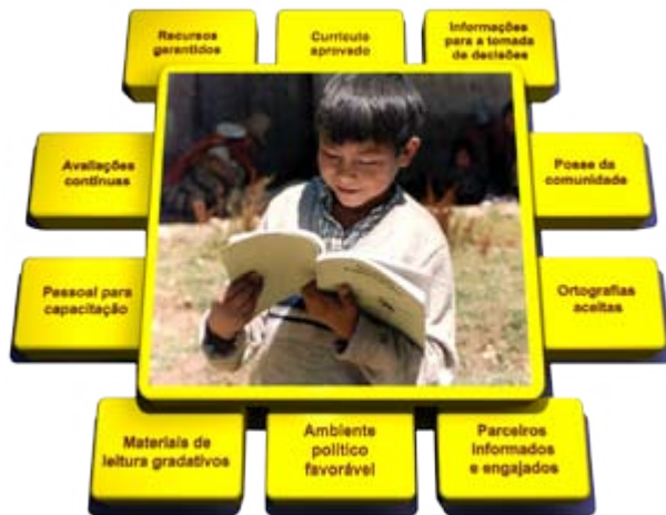
Conceito gráfico pela Susan E. Malone, Ph.D.

Componentes de Programas de Educação Multilíngue Sustentável