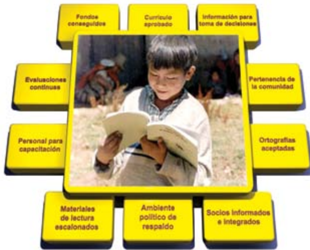
Gráfico por Susan E. Malone, Ph.D.

Componentes de Programas Sostenibles de Educación Multilingüe